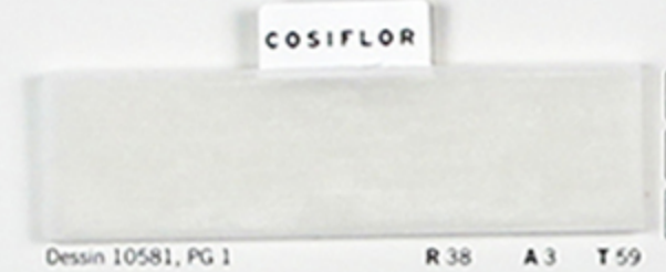
Dessin 10581, PG 1 R 38 A 3 T 59