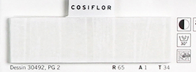
Dessin 30492, PG 2 R 65 A 1 T 34