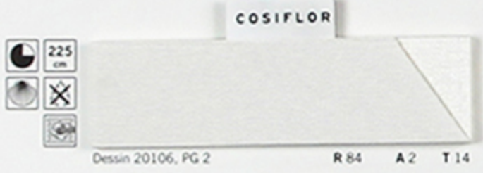
Dessin 20106, PG 2 R 84 A 2 T 14