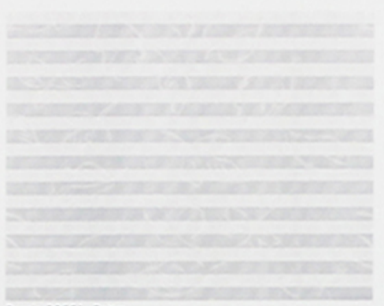
Dessin 30551, Battr