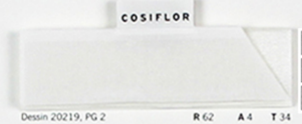
Dessin 20219, PG 2 R 62 A 4 T 34