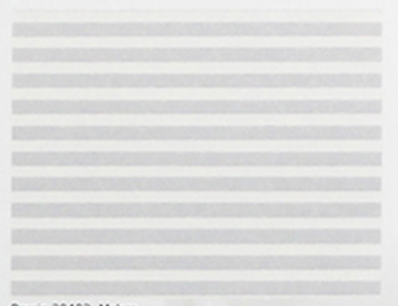
Dessin 30403, Maleza