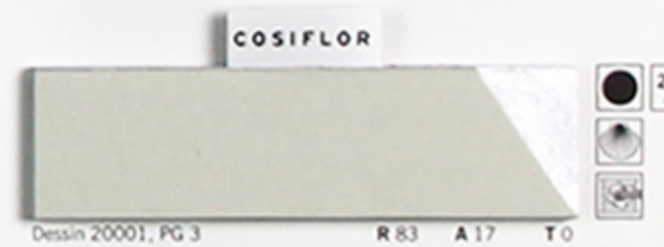
Dessin 20001, PG 3 R 83 A 17 T 0