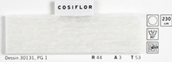
Dessin 30131, PG 1 R 44 A 3 T 53