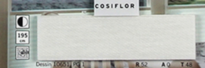
Dessin 10551, PG 1 R 52 A 0 T 48