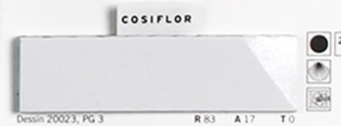
Dessin 20023, PG 3 R 83 A 17 T 0