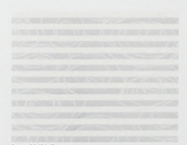
Dessin 30431, Twist