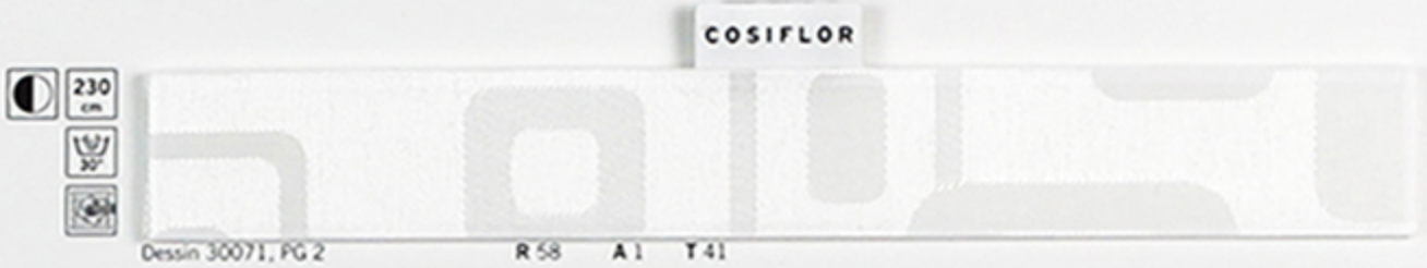
Dessin 30071, PG 2 R 58 A 1 T 41