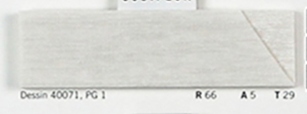
Dessin 40071, PG 1 R 66 A 5 T 29