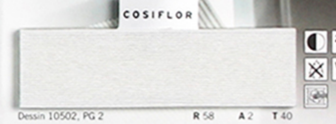
Dessin 10502, PG 2 R 58 A 2 T 40