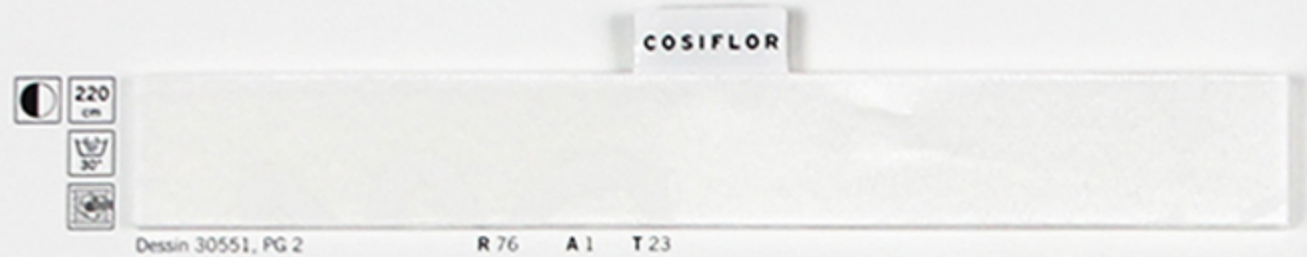
Dessin 30551, PG 2 R 76 A 1 T 23

Genrige Abweichungen bei Farbe und Struktur sind färbungsabhängig und können nicht vermieden werden. Slight deviations in fabric colour and structure are production dependent and cannot be avoided in all cases. Незначительные расхождения в цвете и структуре ткани в зависимости от технологии производства и не могут полностью избежать для расхождений.