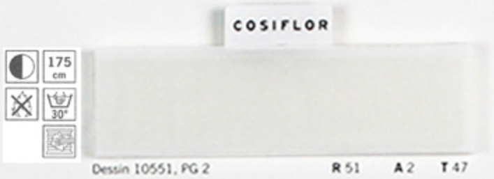
Dessin 10551, PG 2 R 51 A 2 T 47