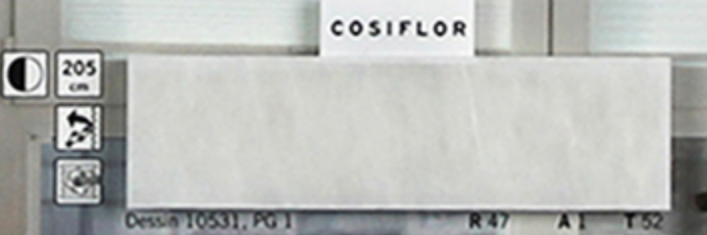
Dessin 10551, PG 1 R 47 A 1 T 52