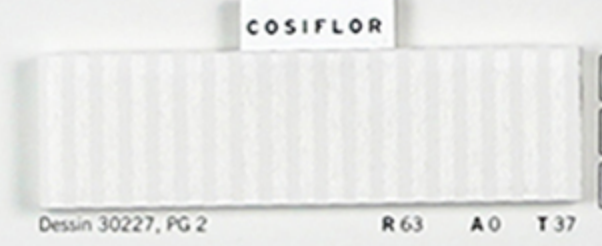
Dessin 30227, PG 2 R 63 A 0 T 37