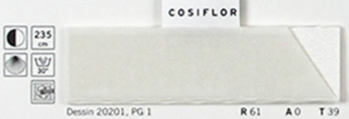
Dessin 20201, PG 1 R 61 A 0 T 39