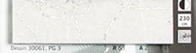
Dessin 30061, PG 3 R 55 A 2 T 41