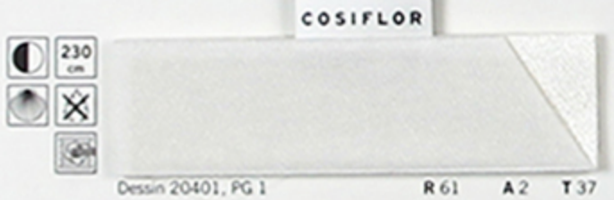
Dessin 20401, PG 1 R 61 A 2 T 37