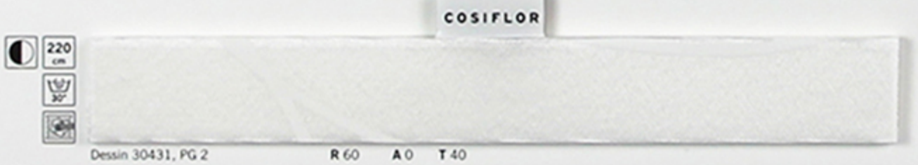
Dessin 30431, PG 2 R 60 A 0 T 40