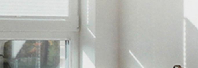
Dessin 30762, PG 2 R 39 A 7 T 54