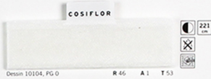
Dessin 10104, PG 0 R 46 A 1 T 53